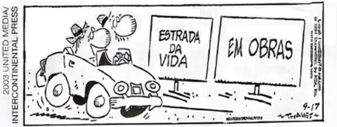
THAVES, Bob. Frank & Ernest .

Disponível em: https://conversadeportugues.com.br/2013/03/leitura/ . Acesso em: 8 fev. 2026.